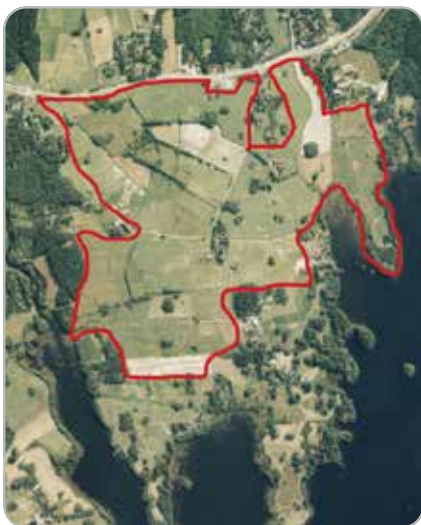
Alustavan suunnitelman mukaan kenttä sijoittuu Nurmin alueelle Näsijärven rantamaisemiin.

Monesta eri vaihtoehdosta työryhmä suositteli kaupunginhallitukselle oheista vaihtoehtoa, jonka kaupunginhallitus 13.6. myös valitsi jatkokon.