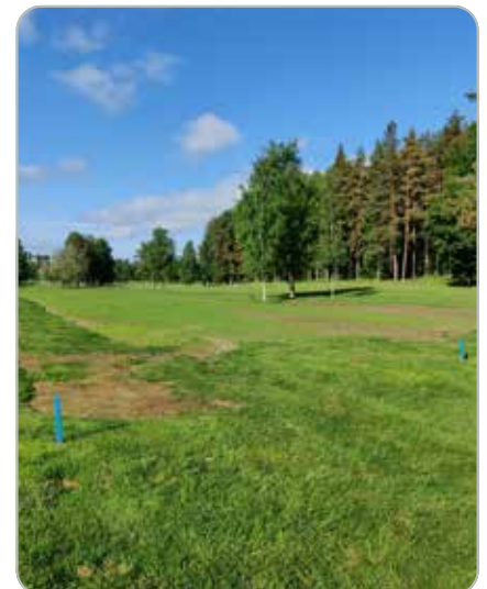
Ankara talvi koetteli Ruotulan kenttää kovalla kädellä.